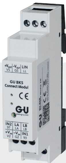
Für den Einbau in Schaltschränken

Ist Ihnen aufgefallen, dass die Anforderungen an die Einbruchssicherheit steigen und gleichzeitig die Nachfrage nach flexiblen Nachrüstlösungen zunimmt? Das GU BKS Connect Modul bietet die perfekte Antwort: manipulationsgeschützte Bus-Kommunikation für maximale Sicherheit – bei gleichzeitig einfacher und schneller Verkabelung. Dank intelligenter 2-Drahttechnik wird das Nachrüsten von A-Öffnern dort möglich, wo bislang nur E-Öffner eingesetzt wurden.