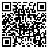
Montagevideo HS LiftUnit

Für Hebeschiebe-Systeme aus Holz, Kunststoff und Metall